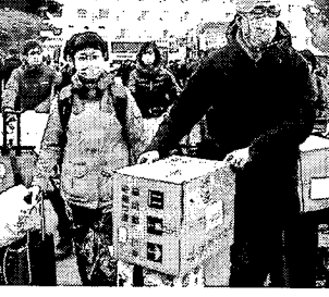
Houve três mil novos casos de febre diuturna por cinco dias consecutivos até a última sexta-feira (7)

O número de mortos causados pelo novo coronavírus na China continental chegou a 811, ultrapassando o total global de mortes da epidemia de SARS em 2003. A Comissão Nacional de Saúde da China anunciou 89 novas mortes no último sábado. O surto de SARS, ou Síndrome Respiratória Aguda Grave, matou 774 pessoas até a declaração do fim da epidemia pela Organização Mundial da Saúde (OMS). O número de novos casos confirmados chega agora a 2.656, elevando o total para 37.198, sendo que 6.188 pessoas estão em condições graves. Houve 3 mil novos casos de febre diuturna por 5 dias consecutivos até sexta-feira (7). Contudo, o número foi menor no sábado. A agência estatal de notícias chinesa, Xinhua, diz que um hospital construído recentemente em Wuhan iniciou a operação neste sábado (8). Segundo relatos, o Hospital