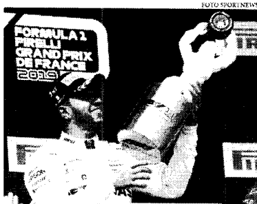
Triunfo leva Hamilton aos 187 pontos na classificação. Inglês abriu ainda mais a vantagem sobre o finlandês Bottas, que tem 151

Nem mesmo quando parou para trocar os pneus, Hamilton perdeu posição.