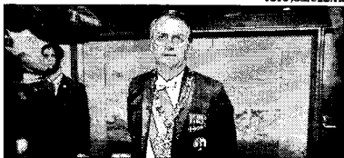
Bolsonaro se reuniu com presidentes das companhias chinesas

FALE COM A GENTE www.estadocem.com.br e-mail: geral@estadocem.com.br