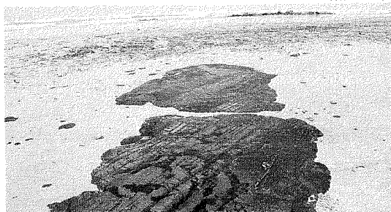
Até o meio desta semana, a mancha já havia contaminado pelo menos 695 áreas de 117 municípios