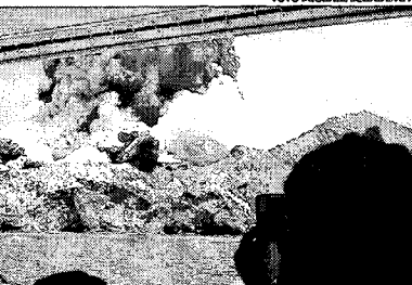
Buscas terrestres e marítimas ainda não conseguiram achar duas pessoas que seguem desaparecidas

O número de vítimas da erupção do vulcão, na Ilha Branca, na Nova Zelândia subiu para 18, ontem, depois da morte de uma australiana num hospital de Sydney, e incluiu dois desaparecidos que continuam sendo procurados, segundo fonte policial. No total, 47 pessoas estavam na ilha no momento da erupção, na última segunda-feira (9), mas as buscas terrestres e marítimas ainda não conseguiram localizar nenhum sinal dos corpos das duas últimas pessoas que continuam desaparecidas. "A equipe de busca está decepcionada. Entendemos perfeitamente como também pode ser querido para os entes queridos que querem recuperar os corpos", disse o comissário da polícia local, Mike Clement, adiantando que, provavelmente, os dois corpos estão na água. Vinte e seis pessoas continuam hospitalizadas na Nova Zelândia e na Austrália, muitas delas em condição descrita pelos médicos como "crítica", com queimaduras em mais de 80% do corpo e