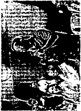
CAPTÃO Wagner faz convenção hoje