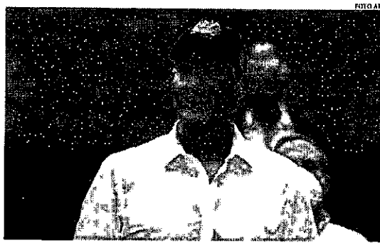
George Forsyth, candidato à Presidência do Peru, durante comício em Lima, capital do Peru

Forsyth não se diz "nem de direita e nem de esquerda" e se apresenta com a típica fórmula do "outsider", que quer gerir o país com técnicos e diretamente com o povo, sem associar-se a partidos tradi-