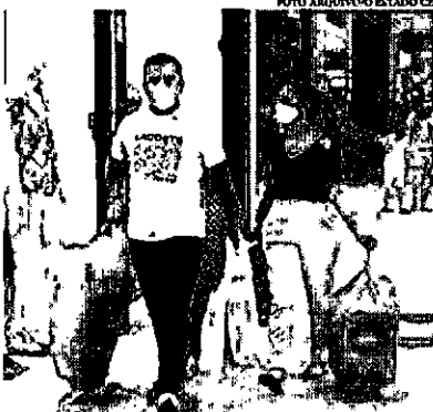
Decreto estadual estabelece que os serviços não essenciais devem funcionar até às 20 horas e inclui o comércio