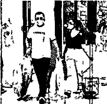
Decreto estadual estabelece que os serviços não essenciais devem funcionar até às 20 horas e incluir o comércio