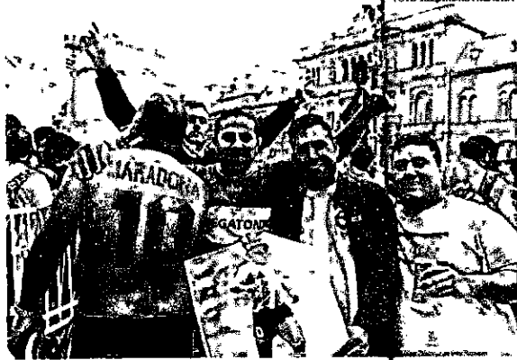
Velório teve de tudo: de culto religioso a confusão generalizada com presença da tropa de choque argentina

As pessoas passam rapidamente diante dele e gritam: "Obrigada, Diego", "Vocé é Deus", além de jogarem camisetas de vários