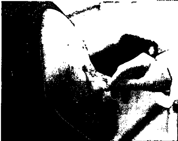
Em Belarus, vacinação será voluntária, e as primeiras doses vão priorizar professores e profissionais de saúde

O ditador bielorrusso, que já teve Covid-19, diz acreditar que, com um estilo de vida normal, uma pessoa tem, em princípio, imunidade suficiente para resistir a muitas doenças. Mas essa é uma decisão privada, afirmou em entrevista: "Pessoal, não como um presidente". No grupo dos políticos autoritários, Lukashenko está so-