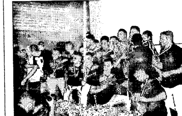
UM TIME CAMPEÃO Aqui está o elenco campeão do futsal do Centro Sporting Club quando recebeu os medalhões do título conquistado.