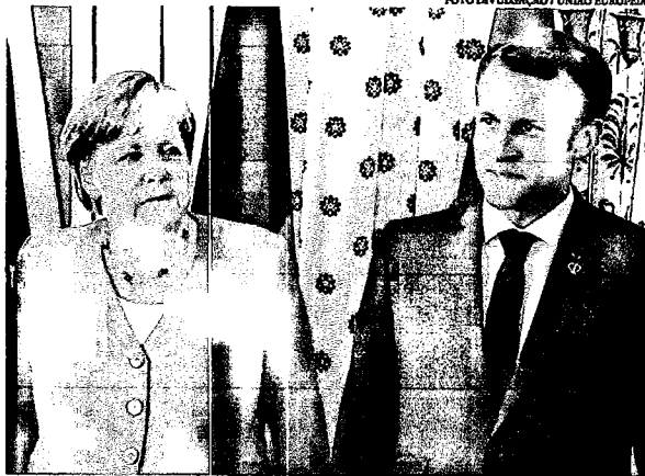
Na recuperação, a Europa precisa em especial da atuação de Angela Merkel e Emmanuel Macron

Após três meses de pandemia, a maré de contágio está baixando em quase todo o continente, mas o refluxo deixa descoberto um esqueleto incômodo: lacunas da própria Europa, e não o coronavírus, causam alguns dos principais danos dessa crise. "A Comissão estava despreparada para a pandemia. Quando reagiu, reagiu tarde, foi um pouco ingênua, cética, confusa. Perdeu credibilidade. Governos nacionais já estavam em modo de crise total, e saino cada um para o seu lado tentando responder a seus cidadãos", diz Shadia Islam, diretora de Europa e geopolítica no