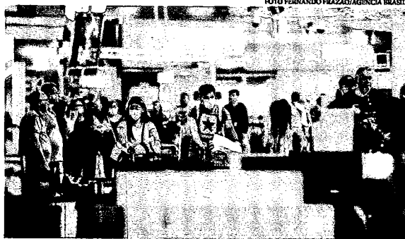
O infectado estava, chegou, recentemente, de uma viagem à Europa, onde passou por vários países

Na terça (3), o Ministério da Saúde decidiu incluir os Estados Unidos na lista de países cujo histórico recente de viagens por pacientes deve ser observado pela rede de saúde para definir casos de suspeita de infecção pelo novo coronavírus.