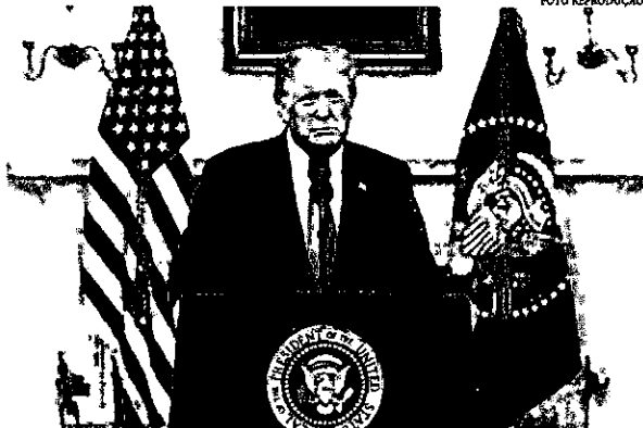
"Temos que responsabilizar a nação que espalhou essa praga pelo mundo: a China"

A 42 dias da eleição, o atual líder americano está atrás do democrata Joe Biden nas pesquisas nacionais e na maior parte dos estados-chave. Assim, ele luta para se eximir de responsabilidades e tentar mudar a narrativa para que o pleito não seja um referendo sobre sua con-