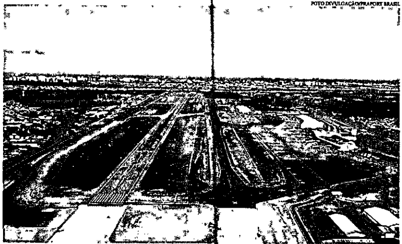
A pista foi expandida em 210 metros, com comprimento total de 2.755 metros. Imagem aérea da obra concluída

As intervenções da pista de pouso e decolagem em 210 metros foram concluídas em 30 de julho, antes do prazo previsto, que era dezembro